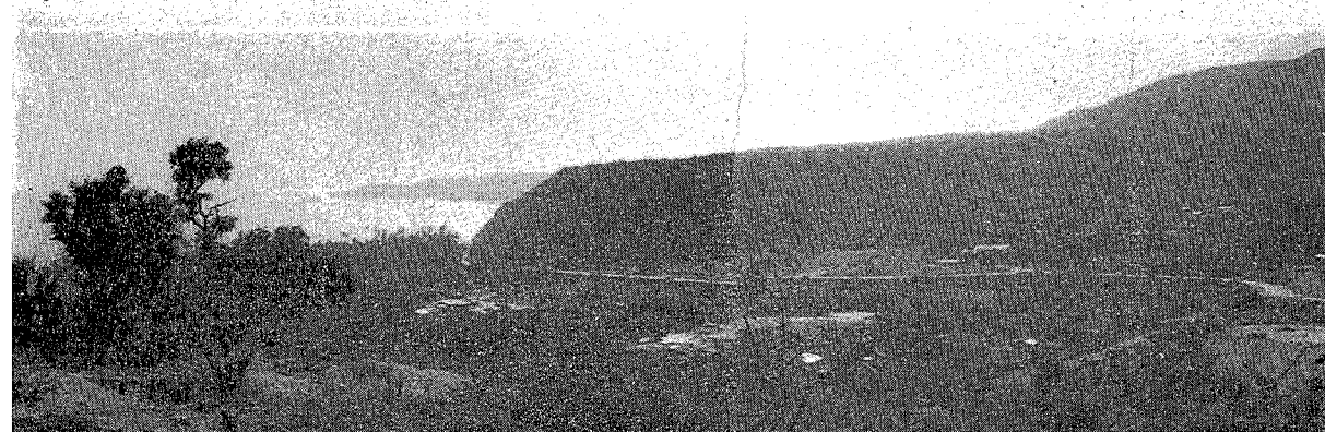
Playa levantada de 50 - 60 m. en el Mamo, desde el W.

Hacia la altitud de 3.500 metros la carretera pasa de la ribera derecho del río a la de la izquierda, precisamente por debajo del muro de la presa que llamamos de la Victoria el cual está cerrando el torrente de un