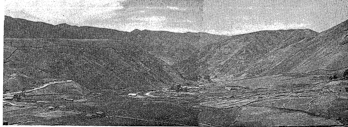
Morrena frontal o terminal de la segunda glaciación, río Chama en la comarca de Apartaderos

En la neviza del Pico Bolívar se observa bien la estratificación horizontal típica de la nieve perpetua, especialmente en lo que llaman el glaciar de los Timoncitos. Igualmente se nota allí el color de la nieve perpetua, que es distinto al de la nieve corriente. La nieve corriente es blanca; la perpetua es siempre azulada o verdoso-azulada.