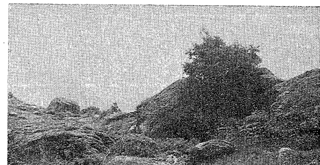
Bloques erráticos y formación morrénica del glaciar del Motaán entre La Venta y el Pico de Aguila.